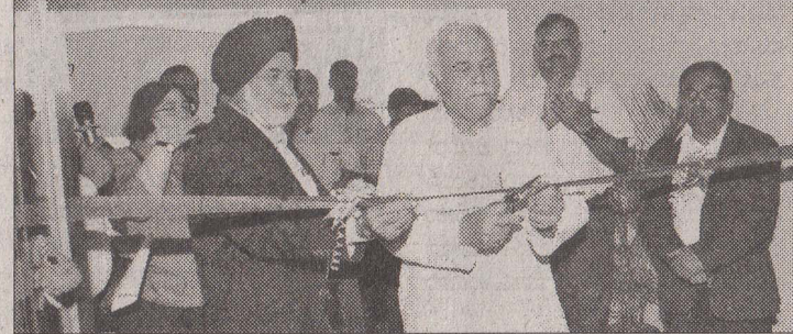
ಧಾರವಾಡ: ಇಲ್ಲಿನ ಬೇಲೂರು ಕೈಗಾರಿಕಾ ಪ್ರದೇಶದಲ್ಲಿನ ಟಾಟಾ ಹಿಟ್ವಾಚಿ ಆಪರೇಟರ್ ಗಳ ತರಬೇತಿ ಕೇಂದ್ರವನ್ನು ಕೈಗಾರಿಕಾ ಸಚಿವ ಆರ್.ವಿ. ದೇಶಪಾಂಡೆ ಉದ್ಘಾಟಿಸಿದರು.

ತಾಲೂಕಿನ ಬೇಲೂರು ಕೈಗಾರಿಕಾ ಪ್ರದೇಶದ ಅಭಿವೃದ್ಧಿಗೆ ನಾನು 18 ವರ್ಷಗಳ ಹಿಂದೆ ಕೈಗಾರಿಕಾ ಸಚಿವನಿದ್ದಾಗಲೂ ಶ್ರಮಿಸಿದ್ದೆ. ಆಗ ಇಲ್ಲಿ ಏನೂ ಇರಲಿಲ್ಲ. ಈ ಪ್ರದೇಶದಲ್ಲಿ ಇಂದು ಸಾವಿರಾರು ಜನ ಕೆಲಸ ಮಾಡುತ್ತಿದ್ದಾರೆ. ಇದೀಗ ಮತ್ತೆ ಕೈಗಾರಿಕಾ ಸಚಿವನಾಗಿದ್ದೇನೆ. ಈ ಪ್ರದೇಶದಲ್ಲಿ ಮೂಲ ಸೌಕರ್ಯಗಳ ಅಭಿವೃದ್ಧಿಗೆ ಕ್ರಮ ಕೈಗೊಂಡಿದ್ದು ಸರಕಾರ 18 ಕೋಟಿ ರೂ. ಬಿಡುಗಡೆ ಮಾಡಿದೆ ಎಂದು ಹೇಳಿದರು.